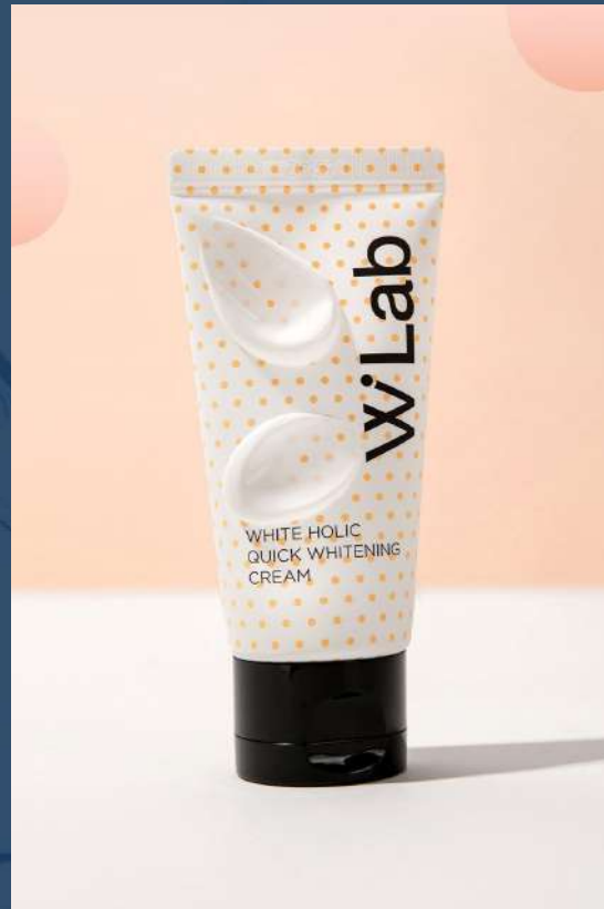
더블유랩 화이트홀릭 퀵 화이트닝 크림