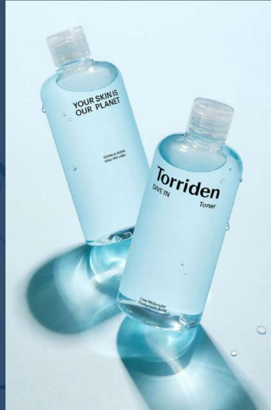
토리든 다이브인 저분자 히알루론산 토너