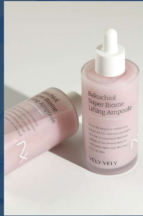
블리블리 바쿠치올 슈퍼바이옴 리프팅 앰플