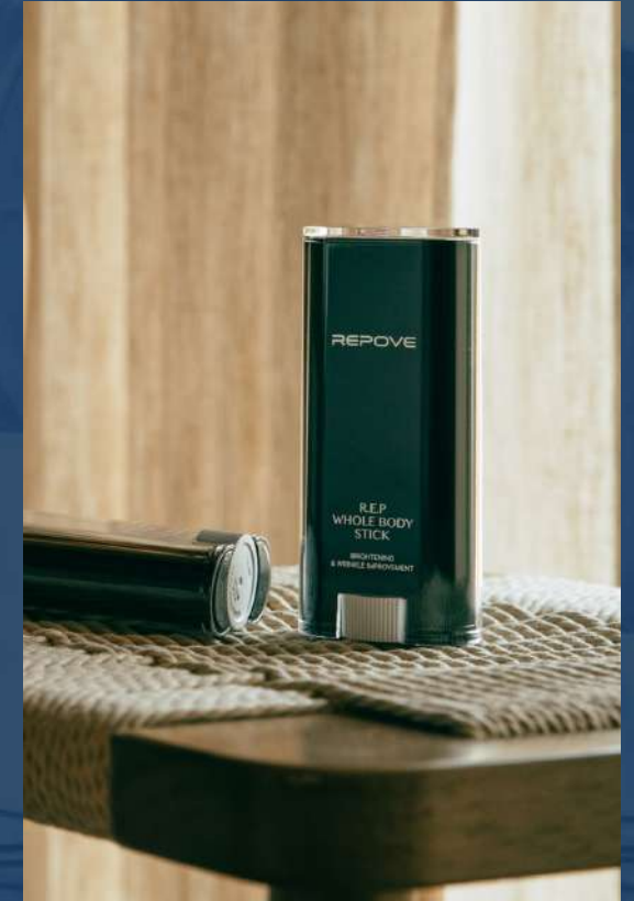
리포브 6G REP 홀바디스틱 & 6G REP 페이스틱