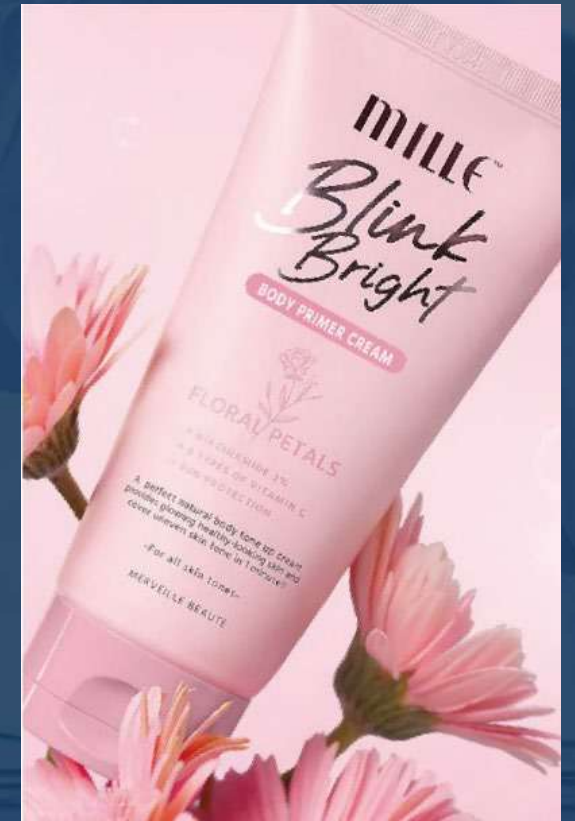
밀레 블링크 브라이트 바디 프라이머 크림