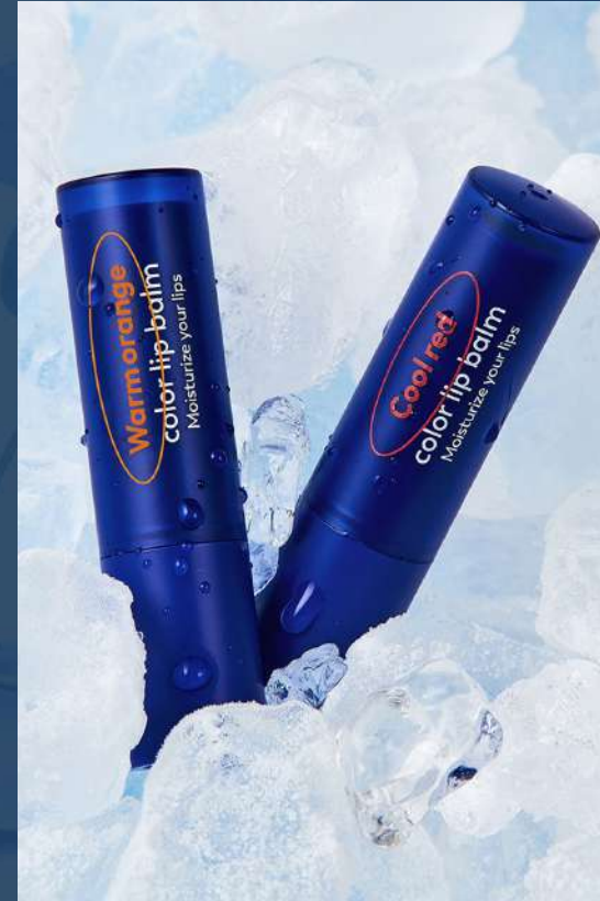
다슈 컬러체인지 립밤