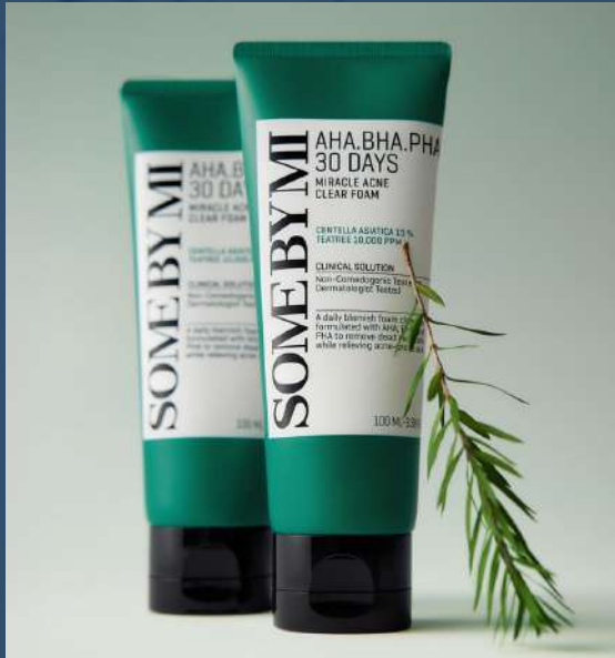
썸바이미 미라클 아크네 클리어 폼