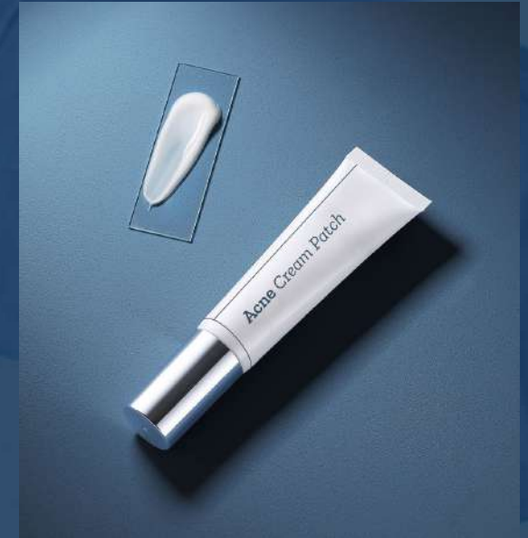
아크네 크림 패치