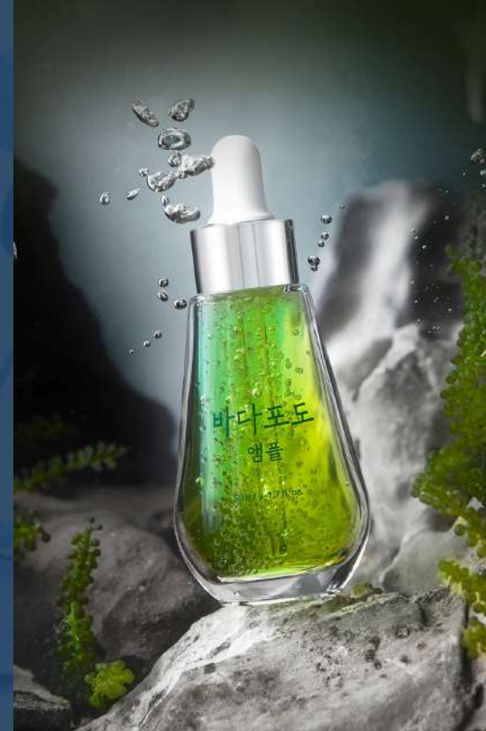
마미케어 바다포도 모공앰플