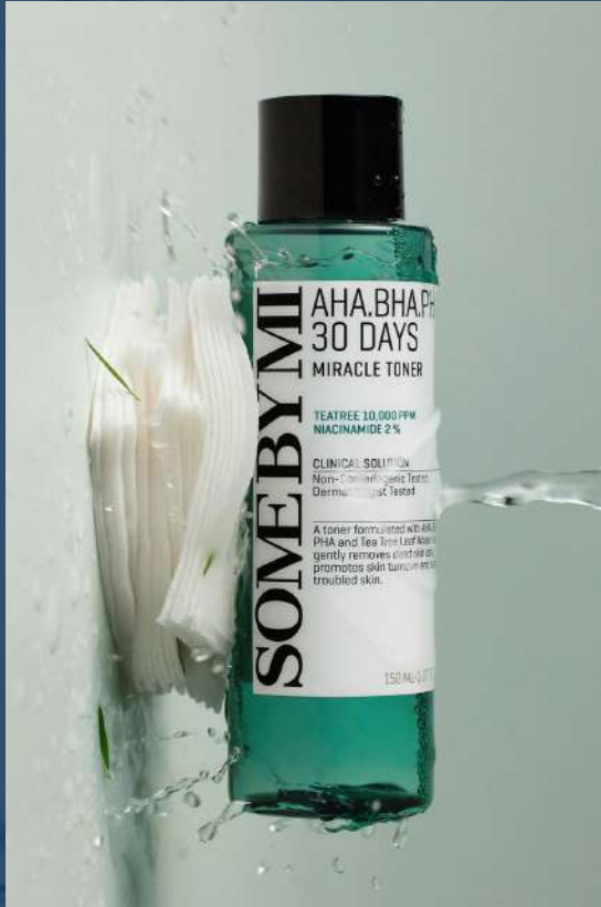
썸바이미 미라클 토너