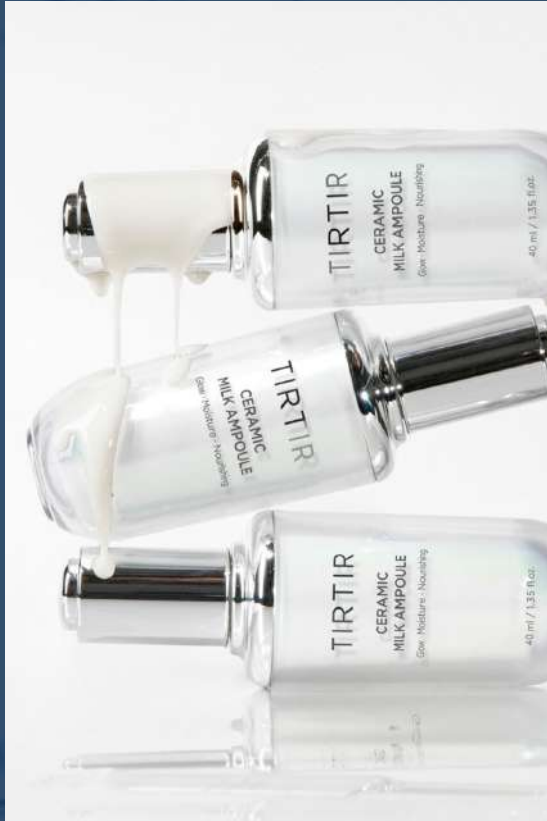
티르티르 도자기 밀크 앰플