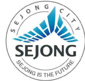
세종특별자치시 고용창출 우수기업