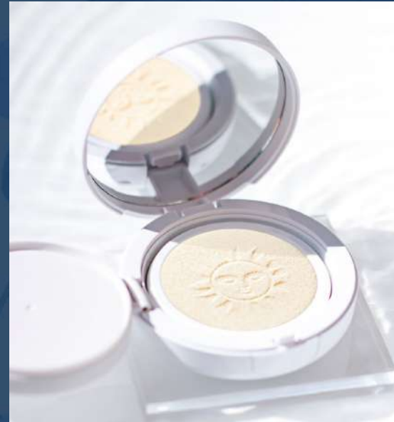
선쿠션 SPF 50, Broad Spectrum