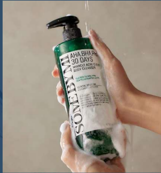
썸바이미 미라클 아크네 클리어 바디 클렌저